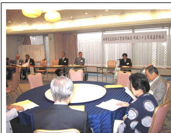
5月25日平成23年度通常総会