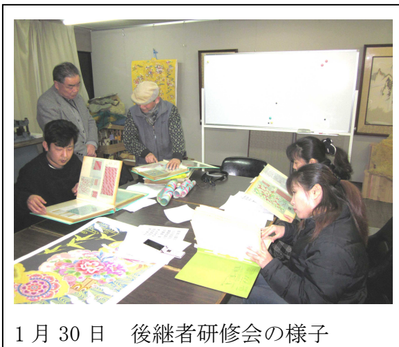
1月30日 後継者研修会の様子