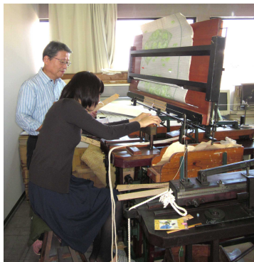
11月4日 体験工房の様子