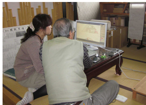
11月10日 体験工房の様子