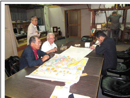
10月14日 工房見学の様子