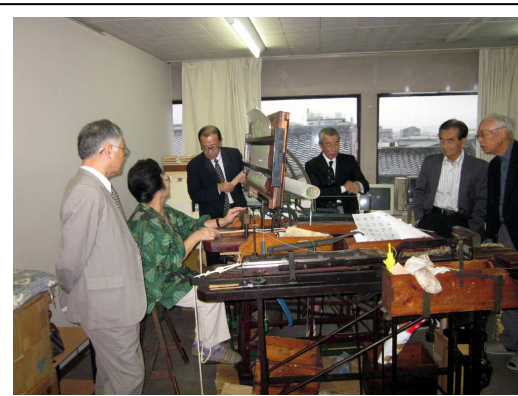
10月14日 工房見学の様子