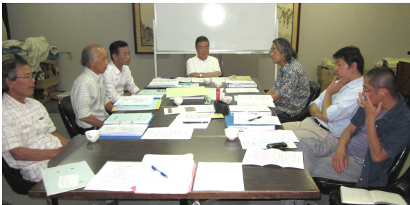
6月定例理事会の様子

結びに、理事全員は仕事を持ちながらの完全なボランティアです。全てにパーフェクトを期待するのは無理があります。組合の存続は皆様の意識で決まります。ご協力をお願いいたします。