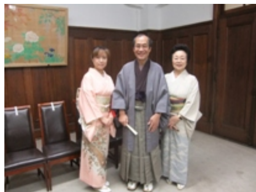
（右：未来の名匠 認定式の様子）