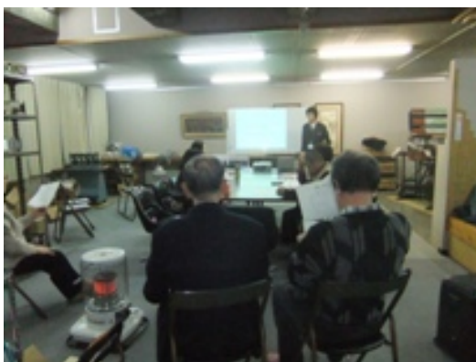
（左：第9回 後継者育成事業の様子）